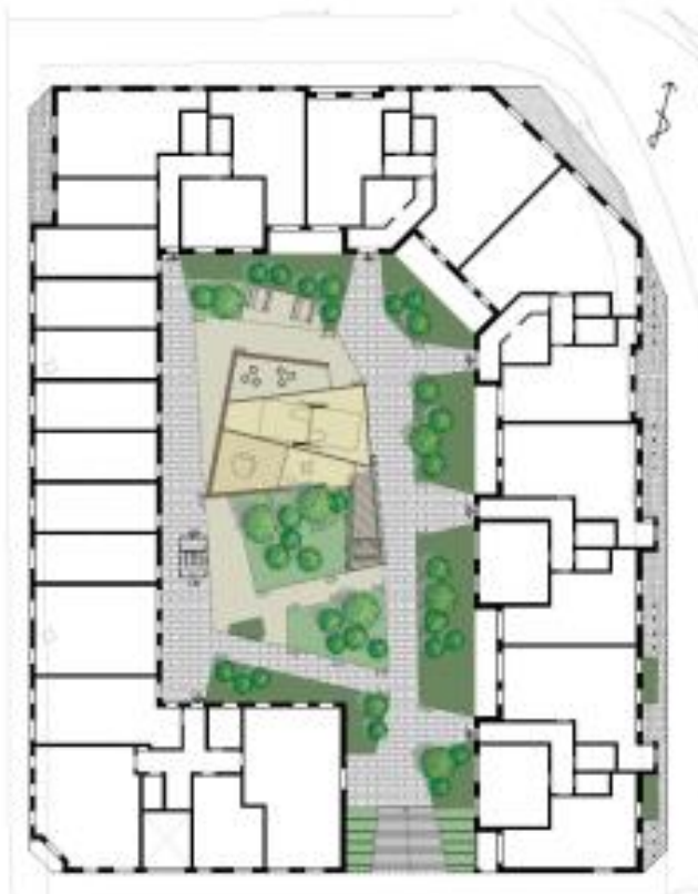
Illustration över gestaltning av inngården.

Sektion från Styrmansgatan till Östra Promenaden. Över parkeringen planeras en planteringsbar inngård med en nersänkt del för regnvatten. Från planbeskrivningen.