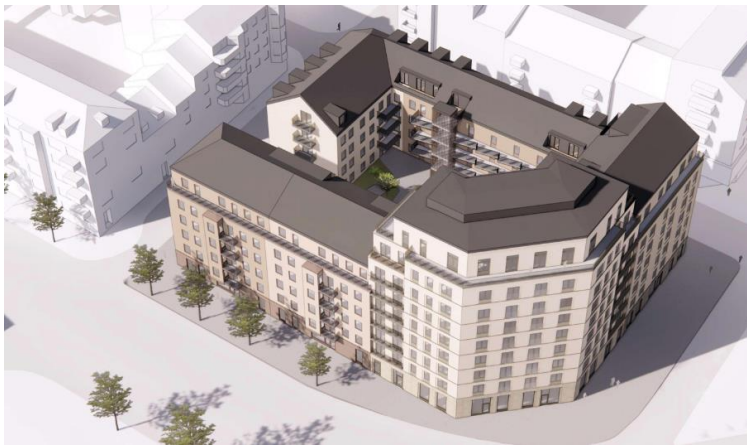
Illustration över planerad bebyggelse, från nordost, korsningen Östra Promenaden/Trädgårdsgatan. Hörnhuset får 9 våningar. Hushöjden trappas ner till 5 våningar mot Hospitalsgatan och Styrmansgatan. 150 lägenheter planeras i kvarteret.