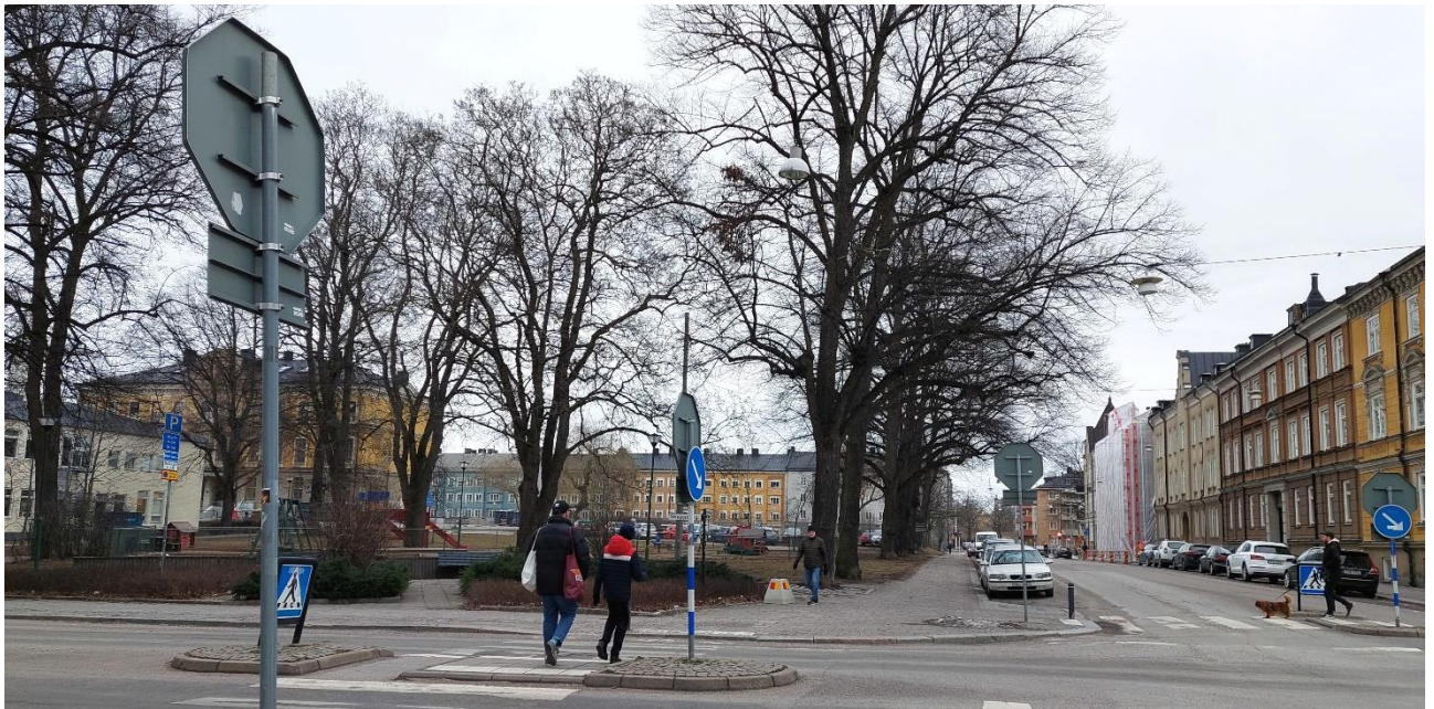
Foto från korsningen Skepparegatan- Hantverkaregatan. I fonden av Hantverkaregatan syns Oxelbergsparken.

Marken i parken är mycket sliten och växtligheten är eftersatt.