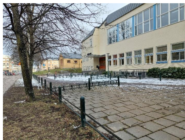
Teknikbyggnader och cykelparkering på parkytan mot Repslagaregatan.