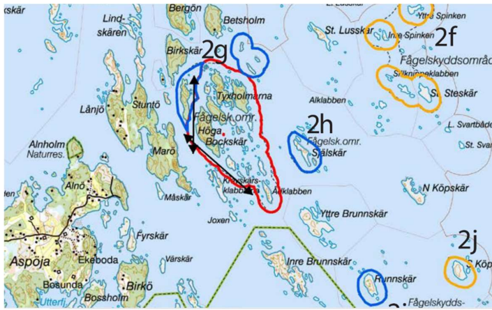
Fig 1. Karta från remissen. Gula områden landstigningsförbud 1/4 - 15/7. Rött område tillträdesförbud 1/2 - 15/8. Blå områden för fågelskydd som föreslås tas bort. Svarta pilar markerar att passage är/blir tillåtna närmare än 100 meter från land. Idag är passage tillåten sydväst om Höga Bockskär. Passage väster om Höga Bockskär är ett nytt förslag.