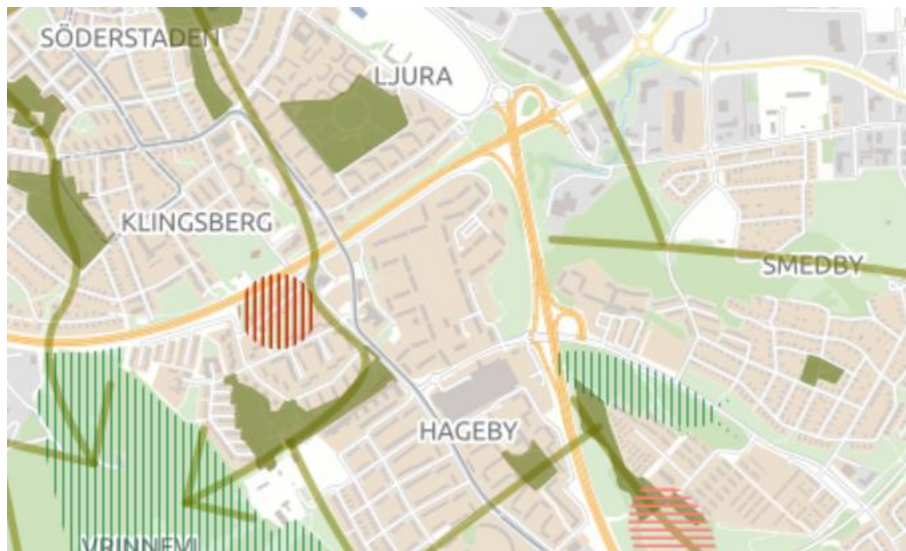
Utsnitt av grönstrukturkartan i ÖP Staden 17. Ett grönstråk går över Kv Portlåset 2 och ett nytt odlingsområde är markerat med vertikala gröna streck.

I översiktsplanen för staden 2017 finns en grönstrukturkarta, med platser för odlingslotter. Kartan är inte redovisad och kommenterad i planprogrammet. Naturskyddsföreningen anser att det är mycket viktigt att grönstrukturen i staden bevaras och förstärks. Det är också viktigt att odlingsområden skapas för boende i stadsdelen.