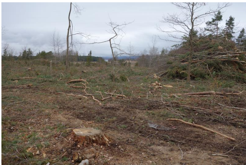
Planområdet har förvandlats till ett kalhygge innan området planläggs. Foto från planområdets södra del mot nordväst.

Planområdet ingår i riksintresset Kustområden och ska skyddas mot påtaglig skada. Skog inom planområdet har fällts innan naturinventering och planens framtagande påbörjats. Det är synnerligen olyckligt och måste hanteras bättre i kommande områden.