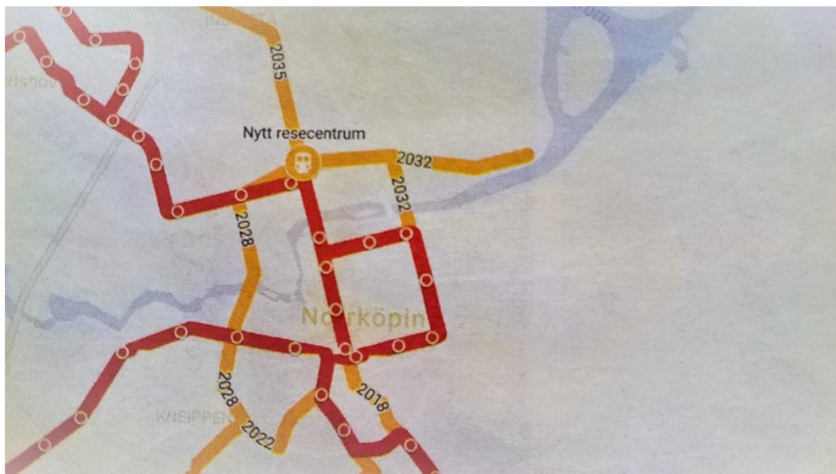
Kommunens spårvägsplan fram till år 2035 Röd = befintlig spårväg Gul = planerad utbyggnad fram till 2035

Exempel på följder av att fördjupad översiktsplan saknas är att man inte beaktat behovet av gång- och cykelbana till Dagsberg. Där finns skola, fritidshem, kyrka, församlingshem, fotbollsplan, Dagsbergs IF:s klubblokal samt planskild korsning till Ljunga med förskola. Vidare skrivs i domen att en ny tillfartsväg bör byggas från Lindö till Marby. Den väg som avses har stoppats på grund av att området hyser mycket stora natur- och kulturvärden i Holmtorpets och Dörestads hagmarker samt Abborrebergs friluftsområde. Istället ska Djurövägen säkerhets- och standardhöjas och förses med gång- och cykelbana och säkrare busshållplatser. Detta projekt är försenat.