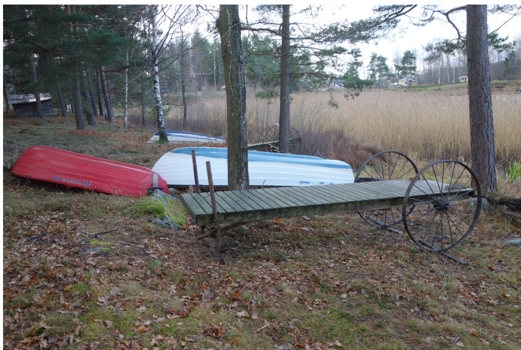
Utefter stränderna ligger en mängd båtar och bryggor på hjul upplagda. Vass är borttaget vid båtarna.