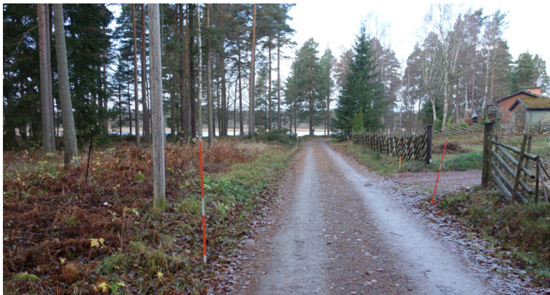
Vy mot Hagnerydsviken. Naturen är påtalande, vägarna enkla och husen inte så dominerande.