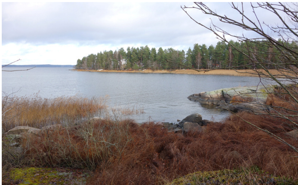
Hagnerydsviken är troligtvis ett viktigt område för fisklek och fågellivet är rikt.

Odensåker ligger ungefär 1 km norr om Skärblackavägen vid infarten till Skärblacka från Norrköpingshället. Det är ett sommarstugeområde från 1950-talet med byggrätt på 50 kvm enplanshus + 20 kvm uthus. Enligt förslaget till ny detaljplan ska byggrätter på 140 kvm i två plan tillåtas + komplementbyggnad på 60 kvm. Platsen har en unik och varierad natur och är allmänt tillgänglig. Väster om sommarstugeområdet finns Hagnerydsviken som är en av flera häckplatser för fiskgjuse utmed södra Glanstranden. Denna är den fiskgjusetaste i hela kommunen beroende på grova tallar med platta kronor lämpade för fiskgjusbon och närhet till fiskrika vatten. Hagnerydsviken är troligtvis ett viktigt lekområde för fisk och övrigt fågelliv är rikt i trakten.