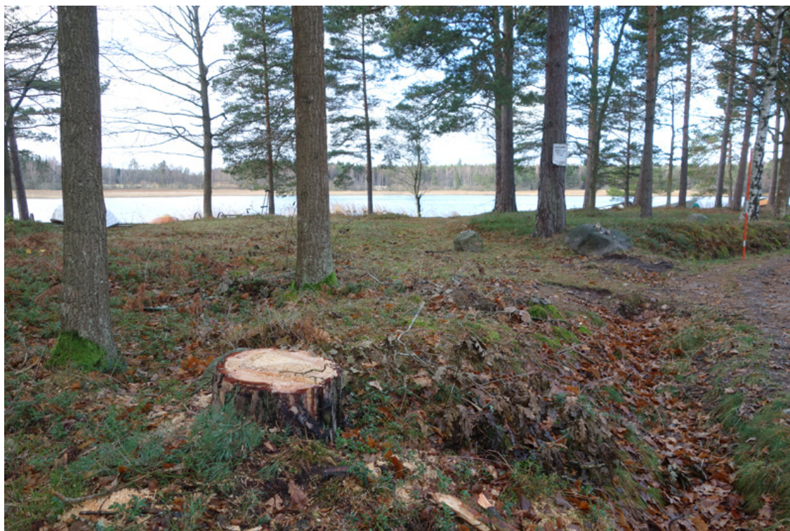
Platsen för en av vändplanerna. Träd har redan tagits ner.